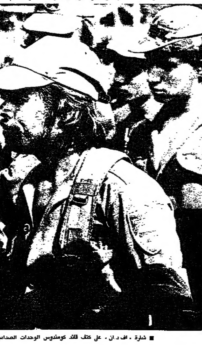
شارة - اف.دان - على خلف قائد كوماندوس الوحدات الصحافية